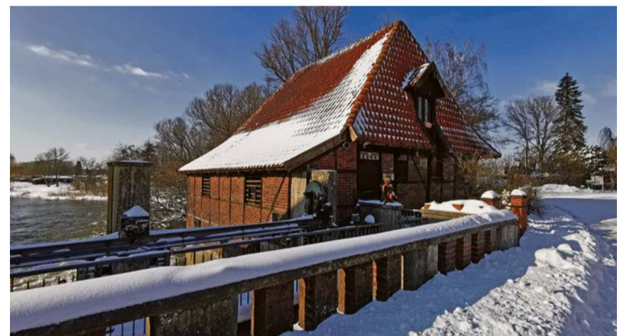
Bis Ende Februar laufen die Instandsetzungsarbeiten an der Füchtelner Mühle.