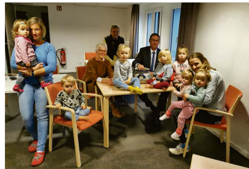
Viel zu tun hatten die kleinen Glücksbringer bei der Ziehung der Losnummern.

Wichtig für die Neuausrichtung sei die Erschließung neuer Zielgruppen und eine strukturierte Kommunikation und Vermarktung. So könne man den Wochenmarkt- und das Gastronomieangebot in das Tourismuskonzept der Stadt integrieren.