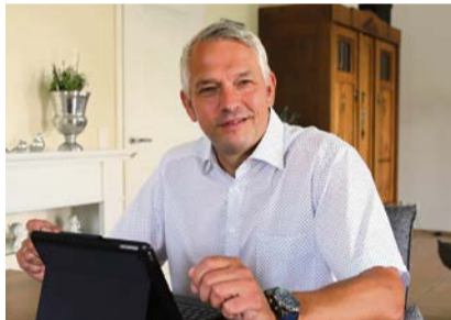
Bürgermeister Wilhelm Sendermann.

Wir wünschen allen Lesern ein besinnliches Weihnachtsfest und ein gesundes und friedvolles 2023.