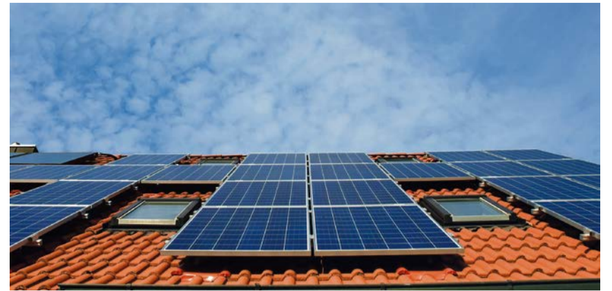
Ob ein Dach in Olfen für Photovoltaik geeignet ist, lässt sich jetzt in Minuten herausfinden.

„Durch die Anschaffung einer Photovoltaik- oder Solarthermieanlage wird klimafreundlicher Solarstrom oder klimafreundliche Solarwärme für den Eigen-