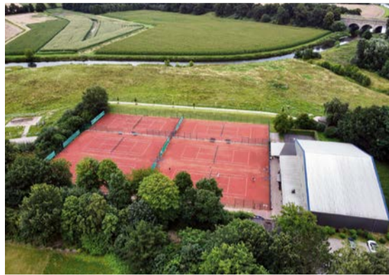
Halle und vier Außenplätze des OTC reichen nicht mehr aus.