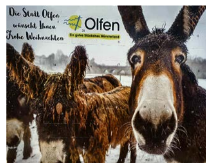
Neu: Ein Schoko-Adventskalender.

Die Kalender sind wie im vergangenen Jahr in zwei verschiedenen Ausführungen: Als A3-Quer Kalender für 15,99 €