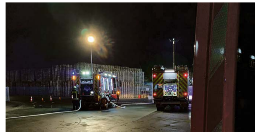
Die Herbstabschlussübung zeigte erneut das Können der Löschzüge Olfen und Vinnum.

„Wir können auf die Feuerwehrfrauen und -männer bauen. Dazu ist aber auch eine adäquate Ausstattung nötig. Die Stadt Olfen hat dabei immer dafür