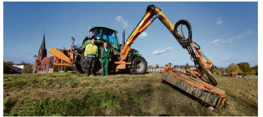
Das Olfener Lohnunternehmen Brüse hat die Mäharbeiten an der Alten Fahrt vorgenommen.

Außerhalb solcher Wildblumenbereiche und an anderen Stellen des Stadtbe-