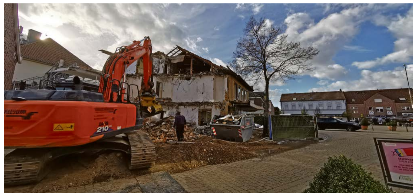
Die Abrissarbeiten neben dem Rathaus sind abgeschlossen. Zeitnah kann mit dem Bau des neuen Rathauses begonnen werden.