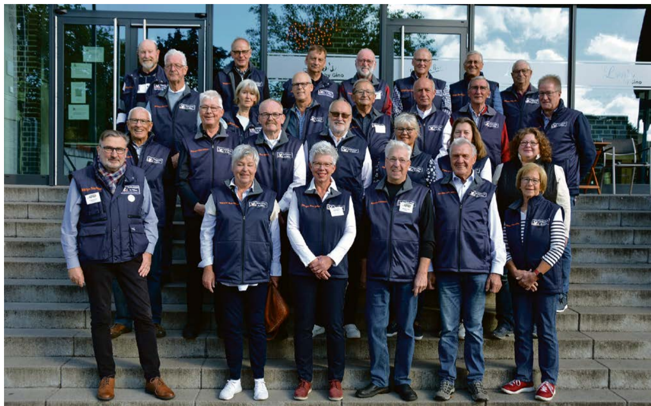
Eine ganze Mannschaft ehrenamtlicher Mitglieder sorgt mit dem Bürgerbus dafür, dass die Fahrgäste in Olfen immer pünktlich zu ihrem Ziel kommen. Jetzt konnte der Bürgerbusverein Olfen mit vielen Gästen aus Gesellschaft und Politik sein 25-jähriges Bestehen feiern.