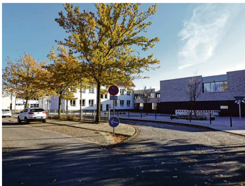
An der Wieschhofgrundschule wird an dieser Stelle ein Schrankensystem installiert. Mit der Neuordnung des Verkehrs will die Stadt Olfen für mehr Sicherheit der Kinder sorgen.