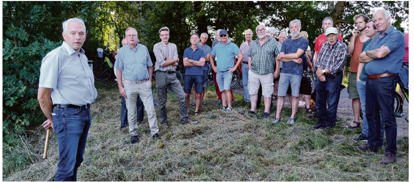
Endgültiges oder vorläufiges Aus für die „Neue Stever“? Hier ein Foto von einer der Infoveranstaltungen zum Projekt.

Ob der Ausstieg aus dem Gesamtprojekt vorläufig oder endgültig sein soll – diese Entscheidung wurde auf die Ratssitzung am 13. Dezember verschoben.