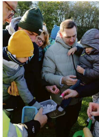
Bevor die Baumpaten loslegen konnten, mussten die Nummern der einzelnen Bäume gezogen und den Paten zugeordnet werden.

Baumpate in Olfen zu werden, das hat eine lange Tradition. Bereits 2008 hatte der Heimatverein Olfen diese besondere Aktion ins Leben gerufen und in Zusammenarbeit mit der Stadt wurden