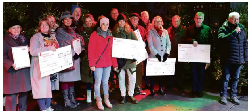
Drei Bürgerpreise und zwei Sonderpreise wurden im Rahmen des Adventsmarktes vergeben.

Außerdem wurden an diesem Nachmittag zwei Olfener Sparkassen-Sonderpreise vergeben, die jeweils mit 1.000 Euro dotiert waren. Ein Preis ging an die Wieschhofschule für die Ausrichtung des traditionellen St. Martinsumzuges. Den zweiten Sonderpreis erhielt der Arbeitskreis Asyl. 2013 gegründet setzten sich die Mitglieder seither unermüdlich und ehrenamtlich für Flüchtlinge in Olfen ein.