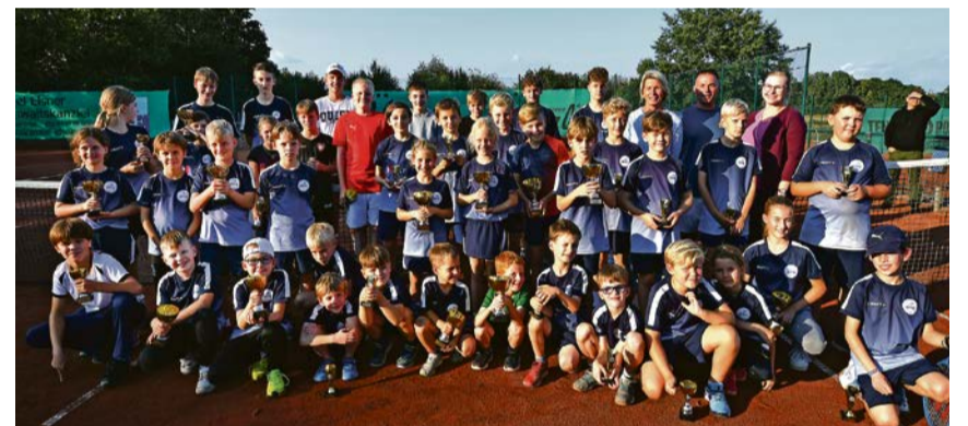
Vereinsmeisterschaften gehören für die OTC-Jugend dazu.