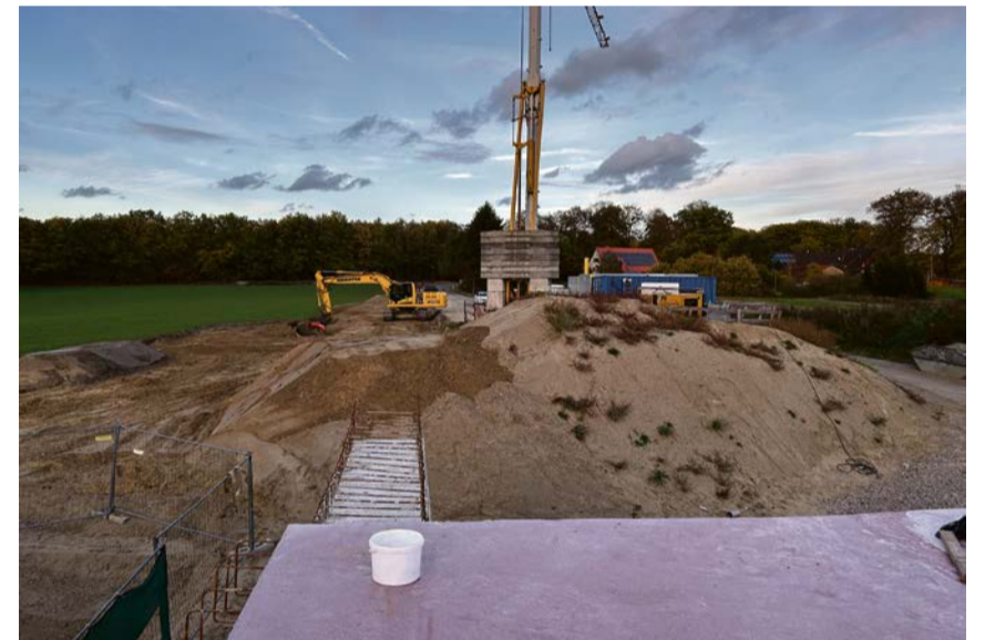
Die Arbeiten an der Ahsener Brücke sind weit fortgeschritten. Jetzt wurde Richtfest gefeiert.