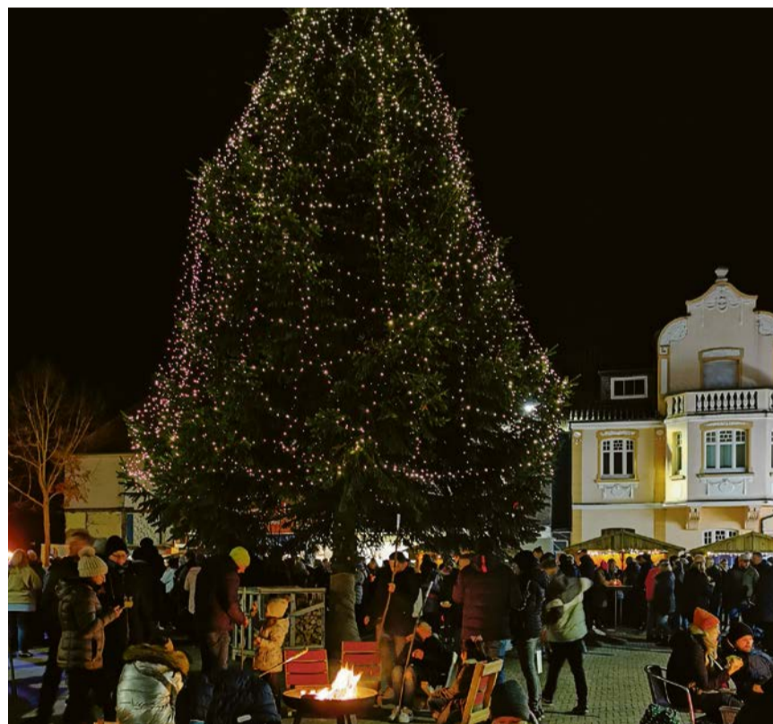
Der Weihnachtsbaum 2022 hatte beim Adventsmarkt schon seinen ersten großen Auftritt.