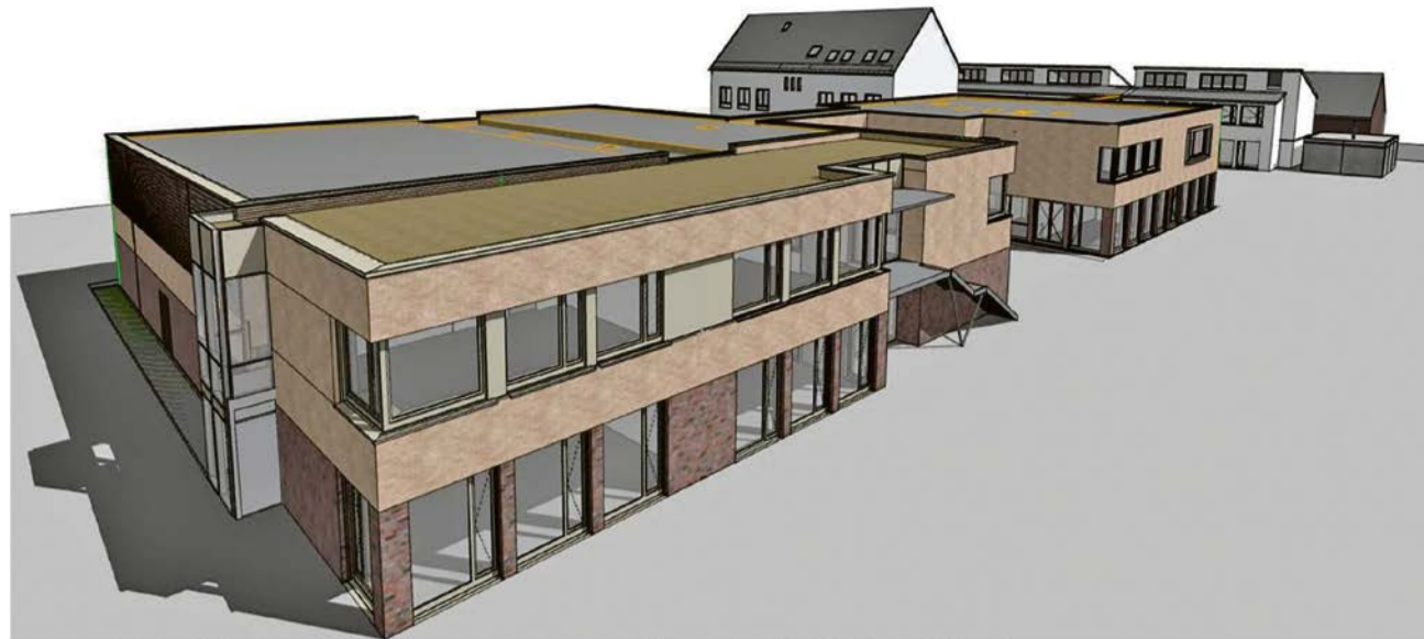
Die Wieschhofgrundschule nach Süden zu erweitern ist der Wunsch der Ausschussmitglieder zweier Ausschüsse.

Grundlage der in der Ausschusssitzung vorgestellten Architektenplanung ist das von der GEBIT erarbeitete Raumprogramm. Acht zusätzliche Räume sollen die Raumeinschränkungen in der Beschulung auf Dauer beseitigen und auch den Betreuungsangeboten in der Schule einen eigenen Platz in der Schule