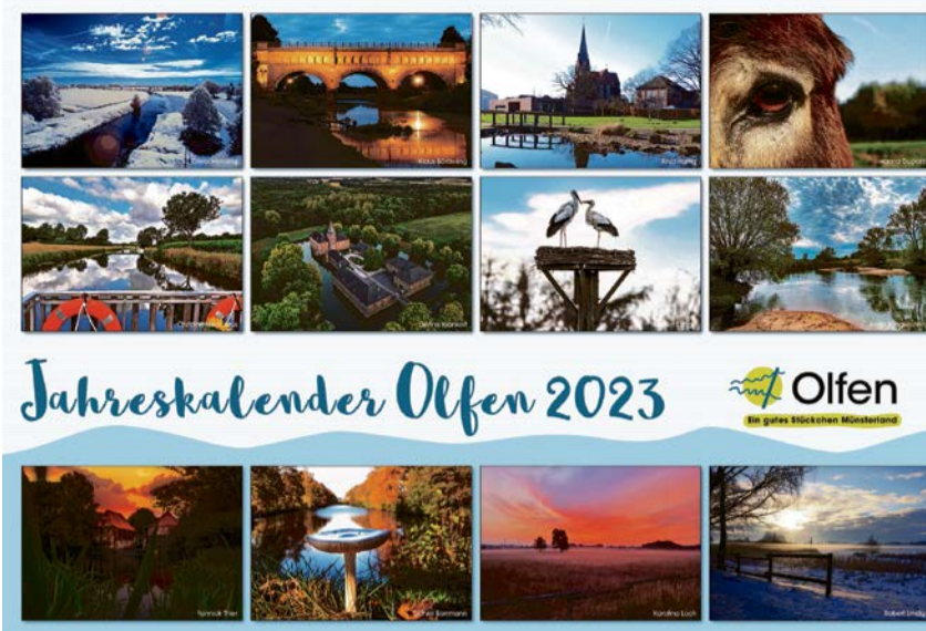
Den Jahreskalender 2023 der Stadt Olfen gibt es in zwei Größen.